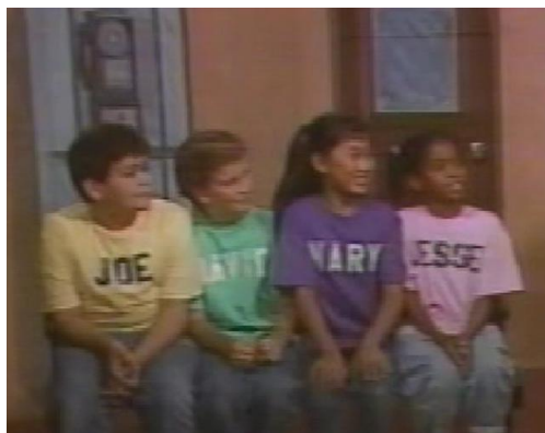
شکل شماره‌ی شش - نمونه پوشش شلوار جین

در این منابع پوشش شخصیت‌ها مطابق با موازین جمهوری اسلامی نیست؛ اما سعی شده است تا بامهارت‌های گرافیکی، بسیاری از این عدم مطابقت‌ها را اصلاح کنند. جدای از این مسأله، تعدادی از لغاتی که در باره‌ی نحوه‌ی پوشش به دانش‌آموزان آموزش داده می‌شود مربوط به نحوه‌ی پوشش غربی است به‌عنوان مثال شلوار جین. طبق نظر بوردیو یکی از مؤلفه‌های سازنده‌ی عادت‌واره نوع پوشش است که ارتباط مستقیمی با طبقه‌ی اجتماعی افراد نیز دارد (گرنفل، ۲۰۰۸). لذا بر اساس نظریه‌ی بوردیو نمایش نحوه‌ی پوشش غربی در کتاب‌های زبان می‌تواند به‌طور غیرمستقیم این ذهنیت را در زبان‌آموز ایجاد کند که پوشش شلوار نوعی نزدیک شدن به فرهنگ بالاتر است.