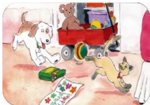
شکل شماره‌ی پنج- نمونه بازی حیوانات خانگی در اتاق نوجوانان

۲- ارتباطات حیوان با حیوان: این منابع نشان می‌دهند که حیوانات همانند انسان‌ها دارای عواطف و احساسات و دارای ساختارهای روابط اجتماعی هستند. در بعضی بخش‌های کتاب و داستان، ارتباطات حیوان با حیوان هستیم؛ به طوری که حیوانات با هم‌دیگر صحبت می‌کنند؛ به ورزش می‌روند، بازی می‌کنند و ماجراهای مخصوص به خود را دارند. اگرچه چنین روابطی جنبه‌ی سرگرم‌کننده‌ی بالایی دارند باید توجه داشت از آن‌جا که این حیوانات غالباً خانگی و دست‌آموز هستند مجدداً فرهنگ نگهداری از حیوانات در منزل را رواج می‌دهند.