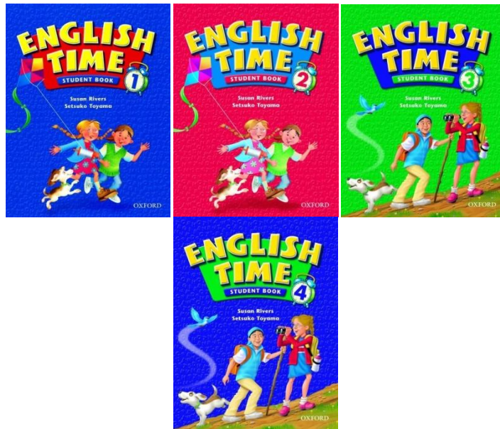
شکل شماره‌ی یک- طرح جلد کتاب‌های ۱ تا ۴ انگلیش تایم

واقع عادت‌واره‌های غربی از طریق زبان به نوجوانان منتقل و آن‌ها نیز با حفظ، تکرار و تمرین، این عادت‌واره‌ها را یاد می‌گیرند و به‌طور ناخودآگاه آن‌ها را محور رفتارهای خود قرار می‌دهند.