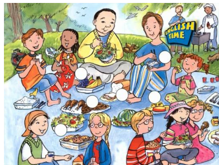
شکل شماره‌ی سه- شرکت دانش‌آموزان غیر هم جنس در پیک‌نیک