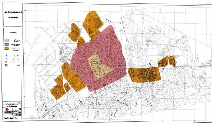
شکل شماره‌ی یک- نقشه‌ی مراحل توسعه‌ی شهر خورموج

توسعه پیدا کرده است. در بخش شمالی توسعه، در این مرحله، شبکه‌ها و خیابان‌ها منظم و نسبتاً عریض می‌باشند. برخلاف بخش شمالی، در بخش جنوبی این قسمت از بافت شهر، شبکه‌ی راه‌ها و میدان‌چه‌های ارتباطی نامنظم بوده و شبیه بافت مرکزی و قدیمی شهر است (مهندسین مشاور طرح آبادی، ۱۳۷۰). شایان ذکر است شهرک‌های شهید شهریار، چمران، پاسداران و مدرس، جزء نواحی جدید در اطراف شهر محسوب می‌شوند. در جنوب، در شرق و غرب جاده، محله‌های خودرو و مهاجرنشین به نام لنگک و خمینی‌آباد نیز جزیی از بافت‌های توسعه‌ی اخیر به حساب می‌آیند (مهندسین مشاور مآب، ۱۳۸۵: ۳). در ادامه، نقشه‌ی مراحل توسعه‌ی شهر خورموج قابل مشاهده است (شکل ۱).