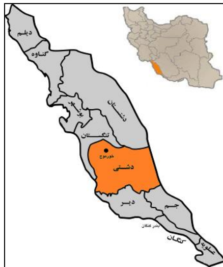
شکل شماره‌ی دو- موقعیت مکانی شهر خورموج و محلات ۱۰ گانه‌ی آن بر روی نقشه