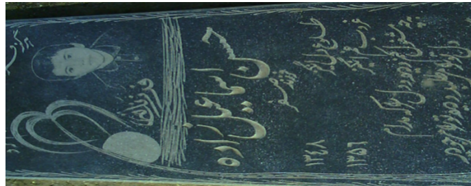
عکس شماره‌ی ۲- نخل (درخت خرما)

داشته، به حدی با توجه و تکریم ایرانیان رو به رو بوده که در اکثر هنرهای ایران قبل از اسلام تصویر و تأثیر آن را می‌توان مشاهده کرد» (ضابطی جهرمی، ۱۳۸۹: ۲۸۴). هم‌چنین انار و نخل در قرآن کریم به‌عنوان میوه‌های بهشتی می‌باشند (سوره‌ی الرحمن، ۵۵: ۸)؛ از این رو، نقش درخت نخل بر مزارها، ریشه در فرهنگ کهن ایرانی داشته و مفهوم باروری و برکت را می‌رساند.