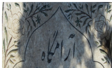
عکس‌های شماره‌ی ۹ و ۱۰- گل سرخ