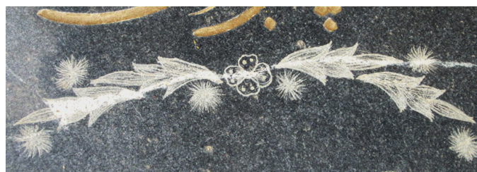
عکس شماره‌ی ۱۶- گل قاصدک

• گل قاصدک: گل قاصدک همان‌گونه که از اسمش پیداست در فرهنگ عامه گل قاصد یا خبرآور است. نقش گل قاصدک به گونه‌ای بر یکی از مزارها (۱۳۶۵.ش) به تصویر کشیده شده که قسمتی از گلبرگ‌هایش بر زمین ریخته است. این گل برگ‌ریزان در پاییز، جدایی و مرگ را تداعی می‌کند و بر مزارها نشانه‌ی مرگ عزیزی است که هم‌چون گلی پَرپَر شده است. هم‌چنین، گلبرگ‌های قاصدک به صورت پراکنده در سرآغاز مزاری مربوط به سال (۱۳۸۱.ش) آمده است.