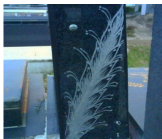
عکس‌های شماره ۵ و ۶- ساقه برنج