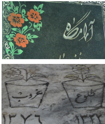
عکس‌های شماره‌ی ۱۴ و ۱۵- شمعدانی

• شمعدانی: نقش گل شمعدانی در حاشیه‌ی مزارها، بسیار به‌کار رفته و در برخی موارد تاریخ ولادت و وفات را بر برگ‌های گل شمعدانی نوشته‌اند. در یک نمونه از مزارها (۱۳۷۶.ش)، نقش دو گلدان و گل شمعدانی دیده می‌شود که بر یکی طلوع و بر دیگری غروب نوشته شده است؛ یکی از گل‌ها به‌صورت پژمرده و خمیده، دیگری تازه و سرزنده است که استعاره از ولادت و وفات است.