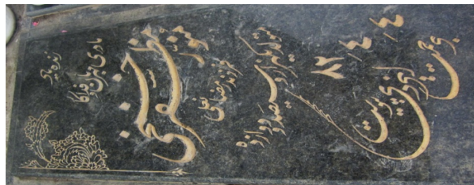
عکس شماره ۲۰. نقش ختایی

علاوه بر موارد فوق، برخی از نقوش ختایی نیز بر مزارهای این آرامگاه دیده می‌شوند. نقوش ختایی از ساقه‌ای اعم از گل، غنچه و برگ تشکیل شده‌اند و از آن‌ها بیش‌تر در حاشیه‌ی مزارها و کادربندی نوشته‌ها در مزارهای خوابیده استفاده شده است. هنرمندان با ترسیم نقوش ختایی بر مزارها، تحرک در زندگی، تمایل انسان به عالم ملکوت و بهشت را یادآور می‌شوند و این نقوش، بیان‌کننده‌ی تأثیر فرهنگ اسلامی و افکار دینی مردم رشت بر مزارها است.