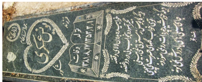
عکس شماره‌ی ۴- گل گندم

• ساقه‌ی گندم: نقش ساقه‌ی گندم بر مزارهای آرامگاه میرزا کوچک بیش‌ترین بسامد را دارد و بر مزارهای دوره‌ی پهلوی و انقلاب اسلامی ترسیم شده است. این نقش در ظاهر شبیه به ساقه‌های گندم است و سنگ‌تراشان آن را «گل گندم» می‌نامند. نقش گل گندم در تمام بخش‌های مزارهای خوابیده: حاشیه‌ها، سرآغاز، اطراف کلمه‌ی آرامگاه و نام متوفی، برای کادربندی در اطراف تاریخ تولد و وفات، متون و اشعار و بر مزارهای محرابی نیز به کار می‌رود. این نقش، ریشه در باورهای مردم رشت دارد و مفهوم باروری و حاصل‌خیزی را می‌رساند. زیرا اقوام مختلف رشت در روز پیش از عید نوروز به همراه هفت سین، سبزه به آرامگاه‌ها می‌برند. هم‌چنین، گندم و برنج برای کبوتران می‌ریزند تا ثوابش به روح متوفی برسد. علاوه بر این، گندم در فرهنگ اسلامی، به داستان آدم و اخراج او از بهشت مربوط می‌شود. وقتی ابلیس به حيله در بهشت شد، آن را «درخت جاودانگی» معرفی کرد.