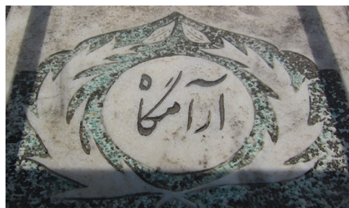
عکس‌های شماره‌ی ۱۷ و ۱۸- برگ نخل

• برگ انجیر: یک نمونه از مزارها (۱۳۷۹.ش) دارای نقش تک برگ انجیر در میان سنگ‌نوشته است. درخت انجیر در قرآن مجید، درختی مقدس و مبارک است و خداوند به آن سوگند یاد کرده است (سوره‌ی التین، ۹۵: ۳ - ۱). «در برخی از باورها نماد فراوانی و برکت و نیز نشانه‌ی علم دین به‌شمار می‌رود. در تفسیرهای قرآن، انجیر میوه بهشتی و ... معرفی شده است. در مقابل بسیاری از