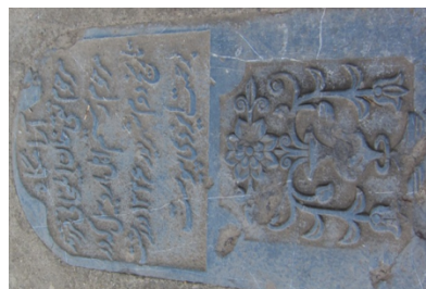
عکس‌های شماره‌ی ۱۲ و ۱۳- نیلوفر