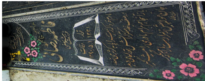
عکس شماره‌ی ۱۱- گل محمدی