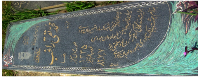
عکس شماره‌ی ۸- گل گلابول