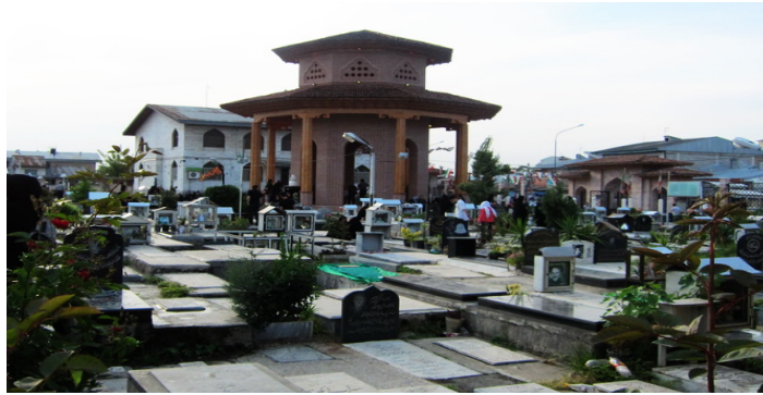
عکس شماره‌ی ۱- نمایی از آرامگاه میرزا کوچک

گورستان معروف و قدیمی «سلیمان‌داراب» که مأخوذ از نام خود اوست دربرگرفته که قدیمی‌ترین آرامگاه رشت است. آرامگاه سلیمان‌داراب بعد از شهادت «شیخ یونس» معروف به «میرزا کوچک» و تدفین او در قسمت شرقی بقعه، «آرامگاه میرزا کوچک» نامیده شد. این آرامگاه در تاریخ ۱۳۸۲/۰۳/۱۰ به شماره‌ی ۸۷۸۲ در فهرست آثار ملی کشور به ثبت رسید.