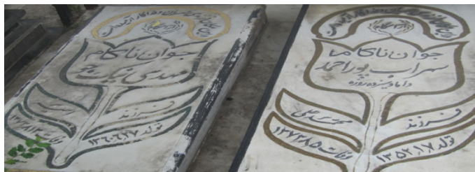
عکس شماره‌ی ۷- گل لاله

● لاله: نقش گل لاله از نقش‌هایی است که بر اکثر مزارهای دوره‌ی پهلوی و انقلاب اسلامی دیده می‌شود و بعد از نقش گل گندم، بیش‌ترین بسامد را دارد. این نقش، در بخش‌های مختلف مزارها از قبیل: سرآغاز، حاشیه‌ها، در دو طرف نام متوفی و کلمه‌ی آرامگاه آمده است. در برخی از مزارها، نقش این گل به صورت برجسته بوده و نام متوفی بر آن نوشته شده و در چند نمونه، نام متوفی بر گل لاله و تاریخ ولادت و وفات بر برگ‌های این گل حک شده است. در فاصله‌ی بین مزار شهدا، برای هر شهیدی نقش یک گل لاله دیده می‌شود؛ زیرا در هنر انقلاب اسلامی، لاله نماد شهید است. «اگر واژه‌ی لاله را قلب کنیم و جای حروف آن را تغییر دهیم نام مقدس الله به دست می‌آید. شاید به این دلیل باشد که گل لاله غالباً در مشاهد متبرکه، کاشیکاری‌های مساجد، بر دیوار آب انبارهای عمومی و سنگ مزارها به‌عنوان زینت منقوش است» (باحقی، ۱۳۹۱: ۷۱۷).