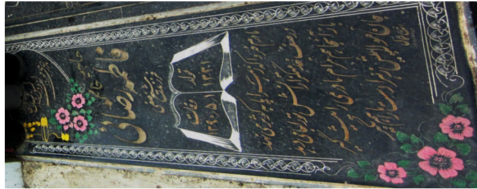
عکس شماره‌ی ۱۱- گل محمدی