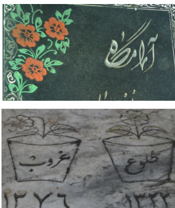
عکس‌های شماره‌ی ۱۴ و ۱۵- شمعدانی

• شمعدانی: نقش گل شمعدانی در حاشیه‌ی مزارها، بسیار به‌کار رفته و در برخی موارد تاریخ ولادت و وفات را بر برگ‌های گل شمعدانی نوشته‌اند. در یک نمونه از مزارها (۱۳۷۶.ش)، نقش دو گلدان و گل شمعدانی دیده می‌شود که بر یکی طلوع و بر دیگری غروب نوشته شده است؛ یکی از گل‌ها به‌صورت پژمرده و خمیده، دیگری تازه و سر زنده است که استعاره از ولادت و وفات است.