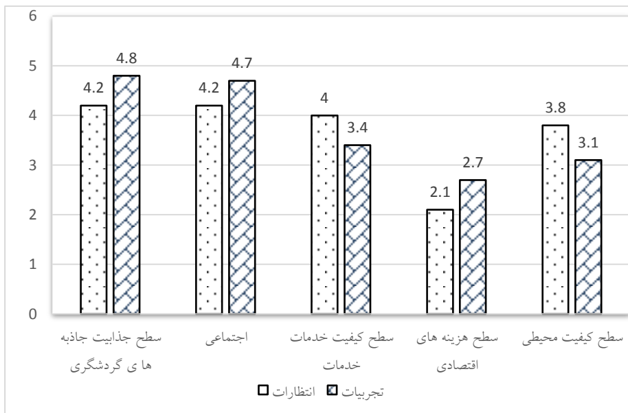
نمودار شماره‌ی یک- سطح انتظارات و کیفیت تجربیات گردشگران روستای صادق‌آباد شهرستان بافق