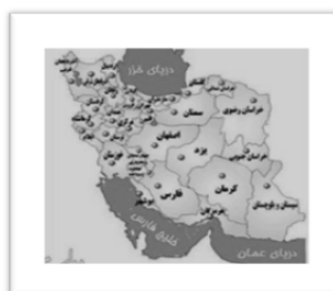
شکل شماره‌ی دو- موقعیت استان اصفهان در ایران