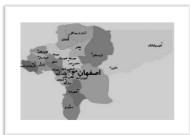
شکل شماره‌ی سه- موقعیت شهرستان آران و بیدگل در استان اصفهان

شهرستان آران و بیدگل از توابع استان اصفهان با وسعت ۶۰۵۱ کیلومتر مربع در پنج کیلومتری شمال کاشان واقع شده است. این شهرستان که در حاشیه‌ی جنوب غربی کویر مرکزی ایران قرار دارد، از شمال به دریاچه‌ی نمک و استان سمنان و قم، از مشرق به شهرستان‌های نطنز و اردستان و از جنوب و غرب به شهرستان کاشان و رشته جبال مرکزی ایران محدود است (سلمانی آرانی، ۱۳۷۷: ۹).