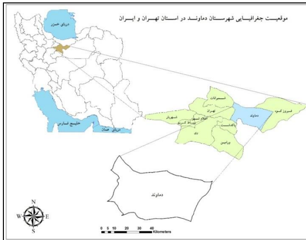
شکل شماره‌ی یک- موقعیت شهرستان دماوند

آبشار آینه‌رود فرح‌افزا و جاذبه‌های منحصربه‌فرد دیگر در گردشگریاستان دارای اهمیت است(ابراهیم زاده و ولاشجردی فراهانی، ۱۳۹۲: ۲۵).