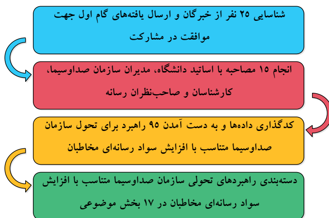
شکل ۲: فرآیند پژوهش در یک نگاه

در مرحله‌ی بعد، یافته‌های هر مصاحبه به صورت مجزا کدگذاری شد و پس از چندین مرحله دسته‌بندی، بازنویسی، جمع‌بندی و همچنین حذف متشابهات، ۹۵ راهبرد برای تحول سازمان صداوسیما، متناسب با افزایش سواد رسانه‌ای مخاطبان در ۱۷ بخش با عنوانین؛ اعتماد مخاطب و بی‌طرفی رسانه، مخاطب پژوهی، تکثیر و تنوع و چندصدایی در رسانه ملی، اقناع مخاطبان، درآمدزایی و کاهش هزینه‌ها، تولیدات، نیروی انسانی، فضای مجازی و رسانه‌های اجتماعی، سیاست‌گذاری، رقبا، آینده‌پژوهی، محتوای تولیدشده توسط کاربر، آسیب‌شناسی و اثرسنجی، مزیت رقابتی، نخبگان، برنامه‌ریزی پخش (کنداکتور) و سرعت طبقه‌بندی شدند.