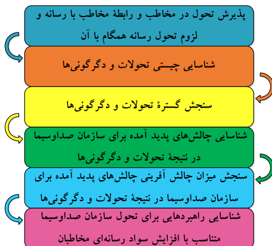
شکل ۳: مسیر سازمان صداوسیما در راه تحول متناسب با افزایش سواد رسانه‌ای مخاطبان

الزام کلیدی و اساسی برای تحول در این سازمان نیز همچون سایر سازمان‌ها در مرحله‌ی اول، پذیرش تحول در مخاطب و رابطه مخاطب با رسانه، توسط مدیران و سیاست‌گذاران رسانه‌ای این سازمان است. این تغییر ذهنیت در مدیران که می‌تواند یکی از سخت‌ترین الزامات این امر باشد، بستر لازم برای مرحله اول تحول از دیدگاه کرت لوین ۱ یعنی مرحله‌ی خروج از انجماد را مهیا سازد.