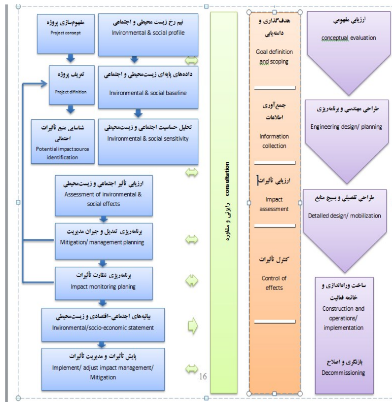
شکل شماره‌ی دو: نمودار مراحل متوالی انجام ارزیابی تأثیر اجتماعی

اتحادیه‌ی تولیدکنندگان نفت و گاز نیز مدلی از مراحل متوالی انجام مطالعات ارزیابی تأثیر زیست‌محیطی و اجتماعی ارائه کرده است که اگرچه پیچیدگی‌های بیش‌تری دارد، لیکن جوهره‌ی آن از آنچه مدل‌های پیشین ارائه می‌کنند متفاوت نیست (OGP, ۱۹۹۷, ۹). این مدل بر مبنای «ارزیابی زیست‌محیطی راهبردی» طراحی شده است. در این نوع ارزیابی، بخش زیست‌محیطی و اجتماعی در کنار یکدیگر قرار داده می‌شوند و ارزیابی به‌طور هم‌زمان صورت می‌گیرد. مدل مذکور از پنج ستون تشکیل شده و اهم نکات درباره‌ی آن به شرح شکل زیر است: