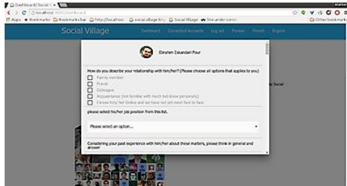
شکل شماره‌ی سه- سؤالات سرمایه‌ی اجتماعی مجازی درباره‌ی دوستان پاسخ‌گو

پروفایل دوستان پاسخ‌گو در شبکه‌ی اجتماعی مجازی، با نمایش نام و تصویر پروفایل دوستان از پاسخ‌گو درخواست شده است به سؤالات پاسخ دهد. این نحوه‌ی پرسش در شکل شماره‌ی سه نشان داده شده است.