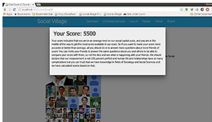
شکل شماره‌ی چهار- امتیاز سرمایه‌ی اجتماعی مجازی پاسخ‌گو به همراه تفسیر آن

پس از پاسخ‌گویی به سؤالات سرمایه‌ی اجتماعی مجازی (که به‌طور جداگانه درباره‌ی شبکه‌ی اجتماعی فیس‌بوک و گوگل پلاس طرح می‌شوند)، بر اساس میزان حمایت و منابع دریافتی پاسخ‌گو از دوستانش، امتیاز سرمایه‌ی اجتماعی مجازی در لحظه محاسبه می‌گردد و به همراه تفسیر مختصری از معنای این امتیاز (جایگاه پاسخ‌گو در طیف حداقل و حداکثر سرمایه‌ی اجتماعی مجازی) به او ارائه می‌شود. این فرایند در شکل شماره‌ی چهار نشان داده شده است.