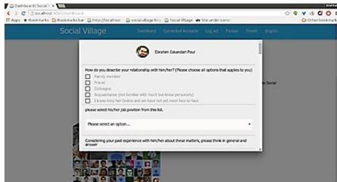
شکل شماره‌ی سه- سؤالات سرمایه‌ی اجتماعی مجازی درباره‌ی دوستان پاسخ‌گو

پروفایل دوستان پاسخ‌گو در شبکه‌ی اجتماعی مجازی، با نمایش نام و تصویر پروفایل دوستان از پاسخ‌گو درخواست شده است به سؤالات پاسخ دهد. این نحوه‌ی پرسش در شکل شماره‌ی سه نشان داده شده است.