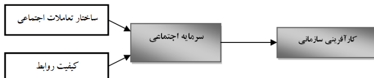
شکل شماره‌ی سه - مدل مفهومی تحقیق