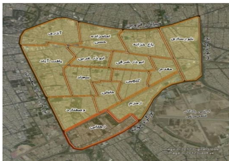
نقشه شماره یک- محله زهتابی در منطقه ۱۷

منبع: سازمان نوسازی شهر تهران و شهرداری منطقه ۱۷ (۱۳۹۸)