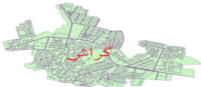
نقشه شماره یک- منطقه مورد مطالعه