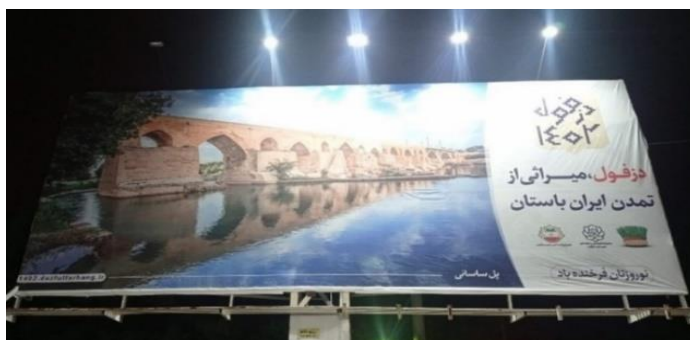
تصویر شماره چهارده- یکی از بیلبردهای نوروزی ورودی شهر

برای مثال تصویر شماره ۱۹ یکی از بیلبردهای نوروزی سال ۱۴۰۲ را نشان می‌دهد؛ که در آن، پل ساسانی به تنهایی به تصویر کشیده شده است. در سمت راست تصویر نیز، این عبارت به چشم می‌خورد: «دزفول، میراثی از تمدن ایران باستان»؛ بنابراین، هدف بازنمایانه این بیلبرد، معرفی دزفول به عنوان شهری باستانی و تاریخی می‌باشد.