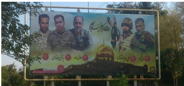
تصویر شماره هشت - یکی از اولین بیلبوردهای مرتبط با شهدای مدافع حرم دزفول

رسانه‌های داخلی، مدافعان حرم، عنوان عده‌ای از نیروهای نظامی هستند که برای کمک مستشاری و عملیاتی در جنگ داخلی سوریه و جنگ علیه داعش سازمان‌دهی و به کشور سوریه اعزام می‌شدند. به افراد کشته شده در این جنگ، نیز شهدای مدافع حرم گفته می‌شود. اولین تأثیر این گفتمان بر چشم‌انداز شهری دزفول، در سال ۱۳۹۴ رخ داد. در این سال، اولین مدافع حرم دزفول به شهادت رسید. از این سال به بعد با افزایش شهدای مدافع حرم دزفولی، بیلبوردهای متعددی در این شهر نصب گردید. این بیلبوردها با افزایش تعداد شهدای مدافع حرم به طور مداوم باز طراحی می‌شدند. در ادامه، پارک جنگلی بزرگ شهر به نام شهدای مدافع حرم نام‌گذاری می‌شود. از آن تاریخ، گفتمان فوق به یکی از جدیدترین منابع تغذیه چشم‌انداز یادبودی شهر دزفول تبدیل شد.