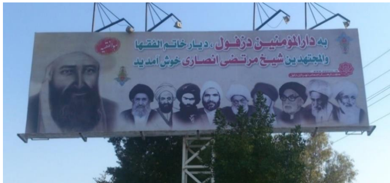
تصویر شماره‌شش - یکی از بلبوردهای ورودی اندیمشک به دزفول

بازنمایی شیخ انصاری در چشم‌انداز شهری دزفول: شیخ انصاری (۱۲۱۴-۱۲۸۱ قمری) مشهور به «خاتم‌الفقهاء و المجتهدین» از مراجع تقلید بزرگ تاریخ تشیع بود. ورود عمده‌ی وی به چشم‌انداز شهری دزفول پس از «کنگره‌ی جهانی بزرگداشت دو‌یستمین سالگرد تولد شیخ انصاری» در سال ۱۳۷۳ صورت می‌گیرد. با برگزاری این کنگره، حاکمیت محلی در شهر دزفول متوجه پتانسیل بالای این شخصیت در بازنمایی شهر دزفول به عنوان یک قطب مذهبی-شیعی می‌شود. چنین شرایطی باعث شد که بزرگ‌ترین میدان شهر در ورودی اندیمشک به نام وی نام‌گذاری شود و پس از آن نام و تصویر وی در سطوح مختلف وارد چشم‌انداز شهری دزفول شود. برای درک بهتر جایگاه شیخ انصاری در چشم‌انداز شهری و به تبع آن حاکمیت محلی، به بررسی یکی از بلبوردهای ورودی شهر می‌پردازیم. این تابلوی نمادین، عصاره‌ای از آن چیزی است که در چشم‌انداز شهری دزفول در ارتباط با روحانیون محلی در جریان است. اهداف بازنمایانه‌ی این بلبورد در ارتباط با شیخ انصاری را می‌توان به شرح زیر عنوان کرد: