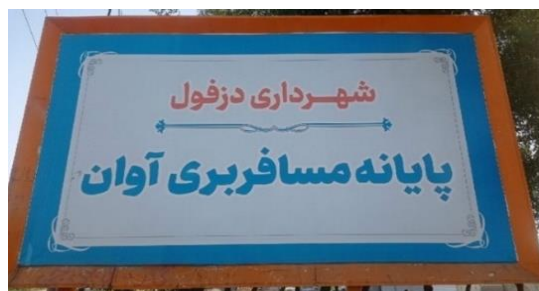
تصویر شماره پانزده- تابلوی پایانه مسافربری به نام آوان

علاوه بر این، اخیراً شاهد هستیم که نام تاریخی برخی از مناطق قدیمی شهر، مجدداً به شهر- متن دزفول بازگشته‌اند. از جمله می‌توان به نام‌های تاریخی پارک دووه، پارک گازر، باغ گودول اشاره نمود. در آخرین موارد می‌توان به تندیس میدان امام خمینی که برگرفته از بافت تاریخی دزفول است و همچنین ساخت میدان کپو اشاره کرد که همانند موارد قبلی، بازنمایی کننده دزفول به عنوان شهری تاریخی هستند. می‌توان گفت با توجه به ضرورت‌های بازاریابی شهری در سال‌های اخیر، تصویرسازی تاریخی از شهر دزفول اهمیت بیشتری پیدا کرده است. کپوبافی (یکی از صنایع دستی شهر دزفول) از جمله جدیدترین مضامین بازنمایانه دزفول است. در سال ۱۳۹۹، دزفول از سوی وزارت میراث فرهنگی به عنوان شهر ملی کپوبافی و در سال ۱۴۰۱ به شهر جهانی کپو معرفی شد.