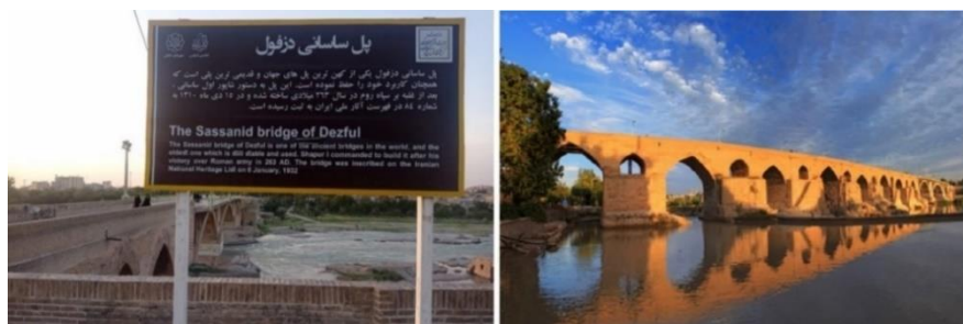
تصویر شماره سیزده- پل ساسانی دزفول

برای مثال تصویر شماره ۱۹ یکی از بیلبردهای نوروزی سال ۱۴۰۲ را نشان می‌دهد؛ که در آن، پل ساسانی به تنهایی به تصویر کشیده شده است. در سمت راست تصویر نیز، این عبارت به چشم می‌خورد: «دزفول، میراثی از تمدن ایران باستان»؛ بنابراین، هدف بازنمایانه این بیلبرد، معرفی دزفول به عنوان شهری باستانی و تاریخی می‌باشد.