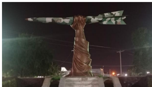
تصویر شماره یک- میدان مقاومت

این شهر در طول جنگ با القاب متعددی چون «شهر مقاومت»، «شهر موشک‌ها» و «شهر هزارموشک» شناخته می‌شد. خود عراقی‌ها به این شهر «بلدالصواریخ» یا شهر موشک‌ها می‌گفتند (خبرگزاری مهر، ۱۳۹۸). در سال ۱۳۶۶، دزفول از سوی هیأت دولت و با نظرسنجی مردمی به‌عنوان «شهر نمونه دفاع مقدس» انتخاب گردید؛ و در چهارم خرداد ۱۳۶۶ با اهدای لوح زرین به مردم دزفول، این شهرستان به‌عنوان «شهر نمونه ایران در دفاع مقدس» نام گرفت. در سال ۱۳۹۰ نیز به مناسبت سالروز اهدای این لوح زرین، با تصویب شورای عالی انقلاب فرهنگی، «چهارم خرداد» به نام «روز مقاومت و پایداری- روز دزفول» در تقویم رسمی ثبت شد. اما در سطح چشم‌انداز شهری ایجاد میدان مقاومت در سال ۱۳۶۸ را می‌توان یک نقطه عطف در این زمینه محسوب نمود. میدان مقاومت که بین مردم به «میدان موشک» مشهور است در سال‌های بعد تبدیل به شمالی برای به تصویر کشیدن موشکباران دزفول شد.