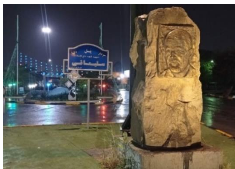
تصویر شمارهٔ نه- سنگ‌نگاره و تابلوی پل سردار سلیمانی

مفهومی این گفتمان با گفتمان عاشورا، در تصویرسازی‌های مرتبط با سردار سلیمانی و سایر شهدای مدافع حرم، شاهد پیوند مستحکمی میان گفتمان مقاومت فرامرزی و گفتمان عاشورایی هستیم؛ بنابراین می‌توان گفت، سردار سلیمانی به نوعی عصارهٔ تمامی مضامین گفتمانی معاصر جمهوری اسلامی است. به هرحال پس از شهادت سردار سلیمانی در سراسر کشور میدان، خیابان‌ها و مکان‌های زیادی به نام وی نام‌گذاری شد. به‌علاوه سردار سلیمانی یکی از معدود افرادی است که پس از انقلاب، مجسمه‌ها و تندیس‌های زیادی از وی ساخته شد.