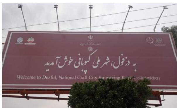
تصویر شماره شانزده- بیلبرد ورودی شهر کپو

علاوه بر این، اخیراً شاهد هستیم که نام تاریخی برخی از مناطق قدیمی شهر، مجدداً به شهر- متن دزفول بازگشته‌اند. از جمله می‌توان به نام‌های تاریخی پارک دووه، پارک گازر، باغ گودول اشاره نمود. در آخرین موارد می‌توان به تندیس میدان امام خمینی که برگرفته از بافت تاریخی دزفول است و همچنین ساخت میدان کپو اشاره کرد که همانند موارد قبلی، بازنمایی کننده دزفول به عنوان شهری تاریخی هستند. می‌توان گفت با توجه به ضرورت‌های بازاریابی شهری در سال‌های اخیر، تصویرسازی تاریخی از شهر دزفول اهمیت بیشتری پیدا کرده است. کپوبافی (یکی از صنایع دستی شهر دزفول) از جمله جدیدترین مضامین بازنمایانه دزفول است. در سال ۱۳۹۹، دزفول از سوی وزارت میراث فرهنگی به عنوان شهر ملی کپوبافی و در سال ۱۴۰۱ به شهر جهانی کپو معرفی شد.