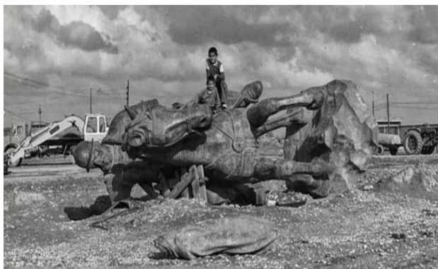
تصویر شماره بیست- مجسمه یعقوب‌لیث در دهه ۱۳۶۰

نصب مجسمه صورت نمی‌گیرد و این مجسمه در یکی از خیابان‌های شهر رها شده است و برای سال‌ها تبدیل به وسیله‌ای برای بازی کودکان می‌شود. میدان محل نصب نیز به سرنوشت مشابهی دچار می‌شود و نام آن به فتح‌المبین تغییر می‌یابد. پس از جنگ، با توجه به ارزش بالای مجسمه و جلوگیری از سرقت آن، حاکمیت محلی تصمیم به تعیین تکلیف مجسمه می‌گیرد. در سال ۱۳۶۹ این مجسمه در مکانی دور از جایگاه اولیه‌اش و به شکلی نه‌چندان مطلوب نصب می‌شود.