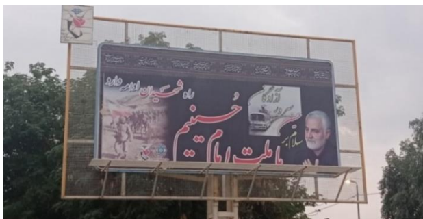
تصویر شمارهٔ ده- یکی از اولین بیلبردهای مرتبط با سردار سلیمانی در ورودی شهر

به تبع آن، شورای شهر دزفول در ۱۴ دی ۱۳۹۸ و درست یک روز پس از شهادت سردار سلیمانی، با نام‌گذاری مهم‌ترین پل رودخانهٔ دز به نام وی، نخستین واکنش خود را به این واقعه نشان می‌دهد و در نتیجه این پل که در ابتدای اصلی‌ترین ورودی شهر قرار دارد به نام «پل سردار دل‌ها، سپهبد حاج قاسم سلیمانی» نام‌گذاری شد. در انتهای پل نیز سنگ‌نگاره‌ای از وی نصب گردید. بلوار ورودی شوشتر و سالن اجتماعات دانشگاه سما نیز به نام سردار سلیمانی نام‌گذاری می‌شود. علاوه بر این، تصویر وی در تمامی بیلبردهای مربوط به مدافعان حرم نقش گردید و به نوعی سردار سلیمانی تبدیل به اصلی‌ترین نماد گفتمان مقاومت فرامرزی شد.