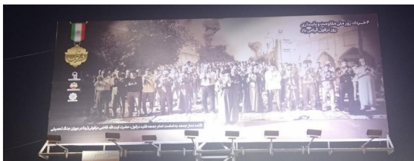
تصویر شماره هفت- تصویر بازسازی شده از اقامه نماز جمعه توسط آیت‌الله قاضی در دوران جنگ با پس زمینه دود حاصل از موشکباران شهر

رقابت معناشناختی اندیمشک و دزفول: ورودی اندیمشک به دزفول-ورودی مشترک هر دو شهر-به‌وسیله میدان جمهوری اسلامی به دو قسمت تقسیم می‌شود. در سمت دزفول، بیلورد آیت‌الله قاضی درست در ابتدای نقطه مرزی دو شهر نصب شده است و این بیلورد اولین نشانه‌ای است که ورود به شهر دزفول را اعلام می‌کند. چنین امری در مجموعه یادمانی «علما و مشاهیر دزفول» نیز دیده می‌شود. این جانمایی نشان‌دهنده جایگاه برجسته این روحانی در تاریخ معاصر دزفول است؛ اما در مورد اندیمشک، به نظر می‌رسد هدف این باشد که در این رقابت معناشناختی به شهر همسایه و همچنین کسانی که به این شهر وارد می‌شوند، نشان داده شود که این شهر خاستگاه روحانیون برجسته‌ای چون آیت‌الله قاضی بوده است.