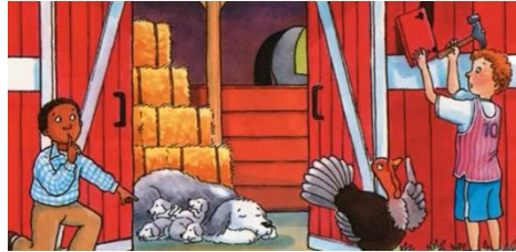
شکل شماره‌ی چهار- نمونه اهمیت انسان به حیوانات

۲۰۰۰). این در حالی است که چنان که گفته شد، نگهداری از حیواناتی چون سگ و گربه در منزل، در فرهنگ ما جایگاه برجسته‌ای ندارد، یا حداقل مربوط به قشری است که یا توانایی داشتن این حیوانات را در خانه دارند و یا نسبت به مسائل شرعی و بهداشتی کمتر حساسیت دارند.