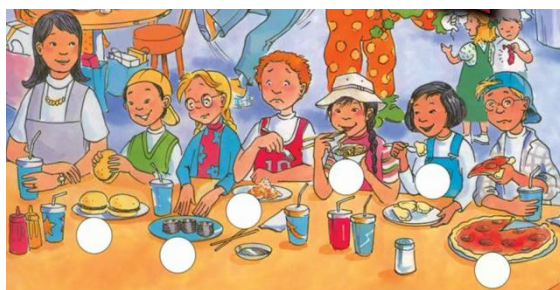
شکل شماره‌ی هفت- نمونه مصرف انواع غذاهای غربی

تنوع‌گرایی در مصرف مواد غذایی، به ویژه غذاهای غربی در این منابع زیاد به چشم می‌خورد؛ همانند همبرگر، پیتزا، اسپاگتی و غیره. به نظر بوردیو سلیقه یکی از آشکارترین نشانه‌های عادت‌واره است که رابطه‌ی مستقیم با موقعیت طبقاتی دارد و می‌تواند از راه آموزش منتقل شود؛ بنابراین آموزش این تنوع غذایی غربی در قالب آموزش زبان، می‌تواند سلیقه و تمایلات نوجوانان را شکل دهد. مه‌ری بهار در کتاب مصرف و فرهنگ نیز به بحث ترجیحات غذایی افراد در گروه‌های مختلف اجتماعی اشاره کرده است (بهار، ۱۳۹۰).