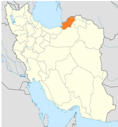
شکل شماره‌ی یک- موقعیت استان گلستان در کشور

شهر گرگان مرکز استان گلستان است که در عرض جغرافیایی 36^{\circ}83' درجه‌ی شمالی و 54^{\circ}48' درجه‌ی طول شرقی قرار دارد. این شهر بر اساس نتایج سرشماری عمومی نفوس و مسکن سال ۱۳۹۵ دارای ۱۱۱۰۹۹ خانوار و تعداد ۳۵۰۶۷۶ نفر جمعیت است که از این تعداد ۱۷۴۷۹۷ مرد و ۱۷۵۸۷۹ زن هستند. شهر گرگان بر اساس تقسیم‌بندی‌های شهری به ۳ منطقه تقسیم شده است. در این تحقیق نمونه‌ها از هر ۳ منطقه انتخاب شدند تا گویای طبقات و اقشار مختلف شهری باشد.