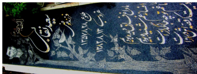
عکس شماره ۳- چنار و انگور

● چنار: نقش درخت چناربر یک نمونه از مزارها متعلق به جوان ناکامی آمده است. چنار در باورهای مردم رشت تقدس ویژه‌ای دارد. بر این درختان پارچه‌های سبز دخیل می‌بندند، زیر آن شمع روشن می‌کنند و حاجت می‌خواهند. «در ایران قدیم چنار، مظهر غنا و باروری، سرسبزی طبیعت، موجب برکت و نعمت خدایان و ارواح بوده است. چنارهای کهن، برکت و پر محصولی را به زمین و خانواده می‌بخشند و موجب بارداری و سلامت زنان می‌شوند» (یاحقی، ۱۳۹۱: ۳۰۵). بعلاوه، در فرهنگ عامه، جوان را در بلندقامتی به چنار و سرو تشبیه می‌کنند.