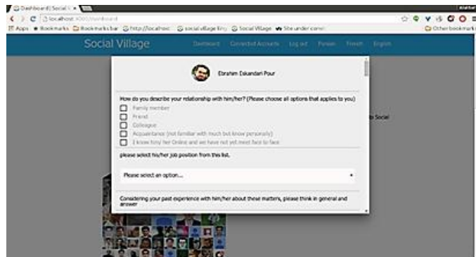
شکل شماره‌ی سه - سؤالات سرمایه‌ی اجتماعی مجازی درباره‌ی دوستان پاسخ‌گو

پروفایل دوستان پاسخ‌گو در شبکه‌ی اجتماعی مجازی، با نمایش نام و تصویر پروفایل دوستان از پاسخ‌گو درخواست شده است به سؤالات پاسخ دهد. این نحوه‌ی پرسش در شکل شماره‌ی سه نشان داده شده است.