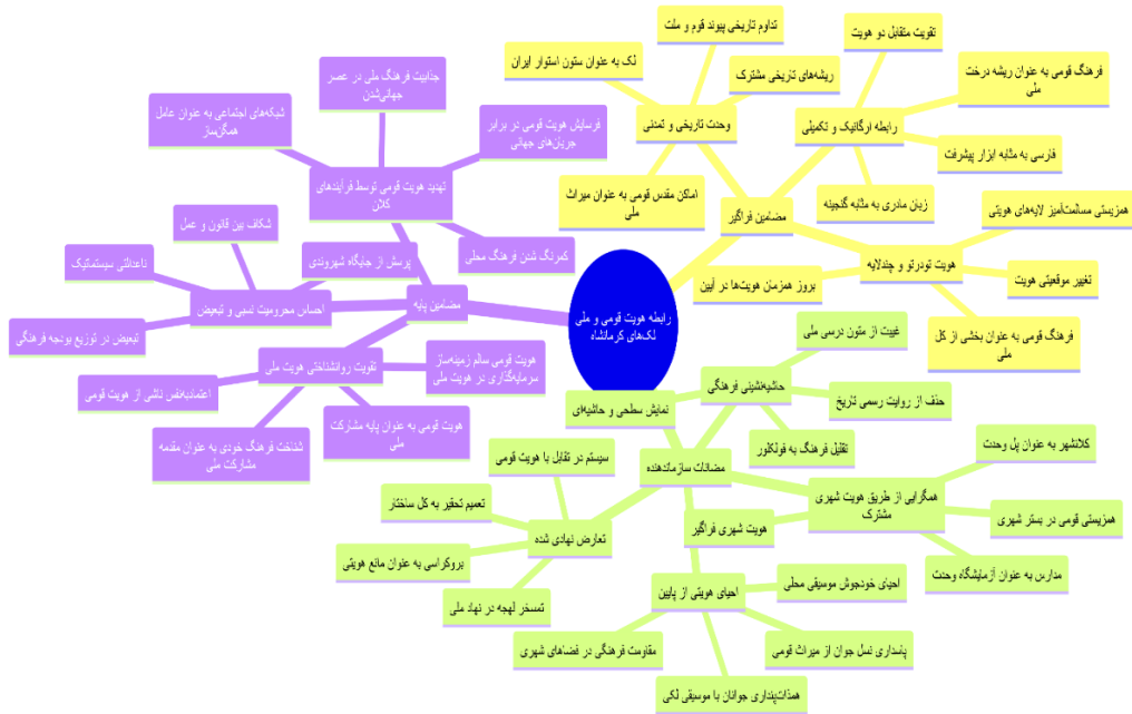
نمودار شماره دو- شبکه مضامین