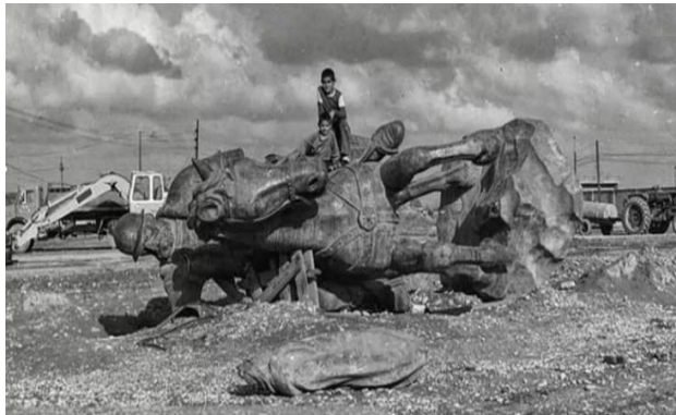
تصویر شماره بیست- مجسمه یعقوب‌لیث در دهه ۱۳۶۰

نصب مجسمه صورت نمی‌گیرد و این مجسمه در یکی از خیابان‌های شهر رها شده است و برای سال‌ها تبدیل به وسیله‌ای برای بازی کودکان می‌شود. میدان محل نصب نیز به سرنوشت مشابهی دچار می‌شود و نام آن به فتح‌المبین تغییر می‌یابد. پس از جنگ، با توجه به ارزش بالای مجسمه و جلوگیری از سرقت آن، حاکمیت محلی تصمیم به تعیین تکلیف مجسمه می‌گیرد. در سال ۱۳۶۹ این مجسمه در مکانی دور از جایگاه اولیه‌اش و به شکلی نه‌چندان مطلوب نصب می‌شود.