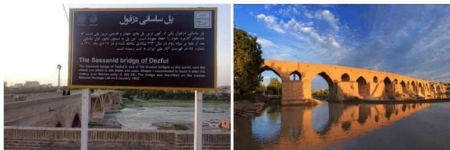
تصویر شماره سیزده- پل ساسانی دزفول

برای مثال تصویر شماره ۱۹ یکی از بیلبردهای نوروزی سال ۱۴۰۲ را نشان می‌دهد؛ که در آن، پل ساسانی به تنهایی به تصویر کشیده شده است. در سمت راست تصویر نیز، این عبارت به چشم می‌خورد: «دزفول، میراثی از تمدن ایران باستان»؛ بنابراین، هدف بازنمایانه این بیلبرد، معرفی دزفول به عنوان شهری باستانی و تاریخی می‌باشد.