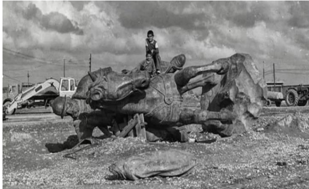
تصویر شماره بیست- مجسمه یعقوب‌لیث در دهه ۱۳۶۰ (عکس از رضا مسعودی نژاد)

نصب مجسمه صورت نمی‌گیرد و این مجسمه در یکی از خیابان‌های شهر رها شده است و برای سال‌ها تبدیل به وسیله‌ای برای بازی کودکان می‌شود. میدان محل نصب نیز به سرنوشت مشابهی دچار می‌شود و نام آن به فتح‌المبین تغییر می‌یابد. پس از جنگ، با توجه به ارزش بالای مجسمه و جلوگیری از سرقت آن، حاکمیت محلی تصمیم به تعیین تکلیف مجسمه می‌گیرد. در سال ۱۳۶۹ این مجسمه در مکانی دور از جایگاه اولیه‌اش و به شکلی نه‌چندان مطلوب نصب می‌شود.