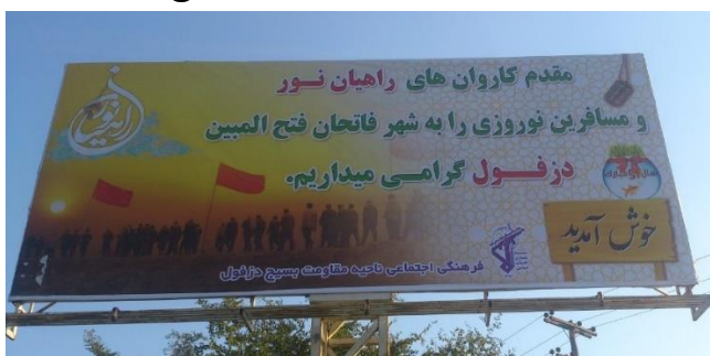
تصویر شماره پنج- یکی از بیلبردهای ورودی شهر دزفول در سال ۱۳۹۷

تصویر شماره چهار- فرماندهان شهید دزفول: در میانه تصویر سردار سوداگر در کانون توجه قرار دارد علاوه بر این موارد، در سال‌های اخیر علاقه رو به رشدی در ارتباط با دو مضمون بازنماییانه دیگر در مورد نقش دزفول و نیروهای نظامی این شهر در دوران جنگ به وجود آمده است. اولی در ارتباط با «عملیات فتح‌المبین» و دومی در ارتباط با «گردان خط‌شکن بلال». اخیراً بحث‌های زیادی در محافل نظامی و سیاسی در ارتباط با این عملیات و نقش شهرهای مختلف در انجام آن شکل‌گرفته است و مدیران شهری دزفول نیز تلاش بیشتری برای تصویرسازی نقش این شهر در این عملیات داشته باشند. برای مثال در یکی از بیلبردهای ورودی، دزفول به‌عنوان شهر «فاتحان فتح‌المبین» معرفی می‌شود که آشکارا به نقش این شهر در عملیات فتح‌المبین اشاره دارد.