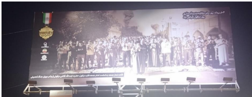
تصویر شماره هفت- تصویر بازسازی شده از اقامه نماز جمعه توسط آیت‌الله قاضی در دوران جنگ با پس زمینه دود حاصل از موشکباران شهر

رقابت معناشناختی اندیمشک و دزفول: ورودی اندیمشک به دزفول-ورودی مشترک هر دو شهر-به‌وسیله میدان جمهوری اسلامی به دو قسمت تقسیم می‌شود. در سمت دزفول، بیلورد آیت‌الله قاضی درست در ابتدای نقطه مرزی دو شهر نصب شده است و این بیلورد اولین نشانه‌ای است که ورود به شهر دزفول را اعلام می‌کند. چنین امری در مجموعه یادمانی «علما و مشاهیر دزفول» نیز دیده می‌شود. این جانمایی نشان‌دهنده جایگاه برجسته این روحانی در تاریخ معاصر دزفول است؛ اما در مورد اندیمشک، به نظر می‌رسد هدف این باشد که در این رقابت معناشناختی به شهر همسایه و همچنین کسانی که به این شهر وارد می‌شوند، نشان داده شود که این شهر خاستگاه روحانیون برجسته‌ای چون آیت‌الله قاضی بوده است.