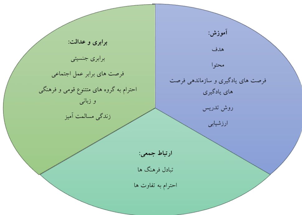
نمودار شماره دو- مضامین اصلی و فرعی مؤلفه‌های آموزش چند فرهنگی