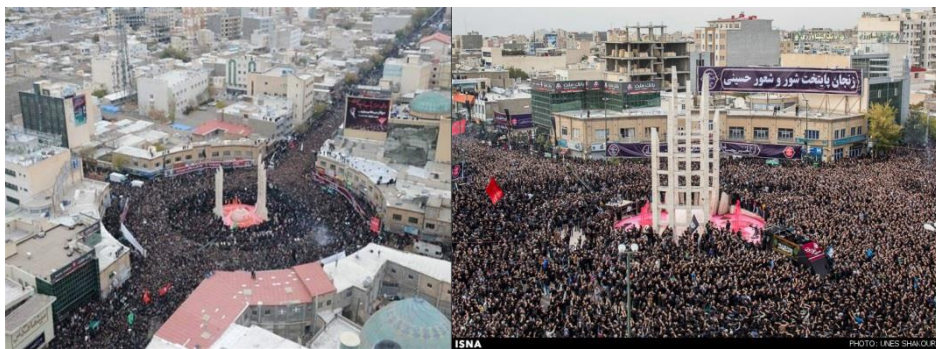
تصویر شماره‌ی یک- عزاداری حسینیه و زینبیه‌ی اعظم زنجان: ایجاد فضاهایی با عملکردهای مختلف مادی و معنوی در راستای تجلی وحدت جامعه

متبرک (عمدتاً امام‌زاده سیدابراهیم) ب: مراسم تجمعی در سطح شهر: این مراسم مانند سینه‌زنی و ذکرخوانی به صورت عمومی در دو ماه محرم و صفر به صورت تجمعی در مرکز شهر زنجان برگزار می‌شود. به منظور برگزاری این مراسم در دوره‌ی قاجاریه هم‌زمان با رونق و شکوفایی این آیین‌ها نظام فضایی میدان- حسینیه به وجود آمد. گردشگری مذهبی در شهر زنجان عمده‌تأثیر نتیجه‌ی وجود این دو مسجد و دسته‌های عزاداری و برگزاری مراسم به مناسبت‌های مختلف به ویژه ایام محرم است. در این ایام گردشگران بسیاری از شهرهای مختلف به ویژه زنجان‌های مقیم شهرهای دیگر، آذری‌زبانان شهرهای اطراف و از کشور آذربایجان به این شهر وارد می‌شوند. جایگاه مذهبی این دو مسجد به حدی است که مردم به احترام آن‌ها در گذر از کنارشان سر تعظیم فرود می‌آورند و ارادت خود را به امام حسین (ع) و حضرت زینب(س) نشان می‌دهند(همان). دهه‌ی محرم و مراسمی که همه‌ساله با شور و شعور مضاعف در گوشه گوشه‌ی کشور برگزار می‌شود، از بارزترین نمودهای گردشگری مذهبی است؛ چراکه هیأت حسینیه و زینبیه‌ی زنجان که به بلندای یک شهر وسعت دارد، یا مراسم طشت‌گذاری مردم زنجان و عزاداری خاص مردم زنجان در هیچ کجای جهان نظیر ندارد و این میراث معنوی نه فقط تاریخ را بلکه تمام شئون زندگی این ملت را تحت تأثیر قرار داده است»(حیدری و محمدی، ۱۳۹۸: ۱۱۱). ثبت این مراسم در فهرست میراث معنوی کشور: مواردی که در قالب دوازده خصوصیت این مراسم به آن اشاره شد، در مجموع باعث شد این آیین با پیگیری‌های پیوسته‌ی سازمان میراث فرهنگی زنجان در تاریخ ۱۳۸۷/۱۰/۱۵ به شماره‌ی ده در فهرست میراث معنوی کشور به ثبت برسد(اوجاقلو، ۱۳۹۵: ۱۰۳).